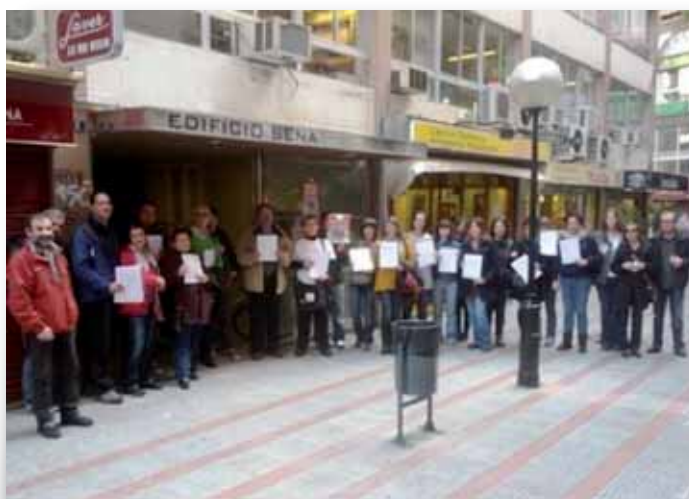
Sindicalistes i docents fent entrega de les seves instàncies a registre

docents a entregar la seva sol·licitud i demà i al llarg de la setmana que ve ho faran altres.