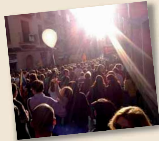
25 de març, Manifestació per la llengua

A les darreres assemblees celebrades als diferents centres educatius de les Illes (unes 50) hem pogut comprovar que la resposta dels docents a la vaga no només està condicionada per les terribles condicions que imposa aquesta