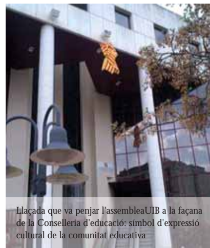
Llaçada que va penjar l'assemblea UIB a la façana de la Conselleria d'educació: símbol d'expressió cultural de la comunitat educativa

mateix a la Conselleria amb l'esborrany del decret d'admissió als centres que ens ha presentat i que només respon al signe polític del partit que ara governa i no al sentir global de la comunitat educativa que hauria d'estar representant. De fet, amb aquesta actitud impositiva, el Govern actua de forma irresponsable i antipedagògica, ja que la resposta que ha provocat i està provocant és justament la contrària a la desitjada i el que ha generat és que fins i tot alguns centres que no tenien la "senyera", quan han rebut la "carta" s'han enfilat a col·locar-la.